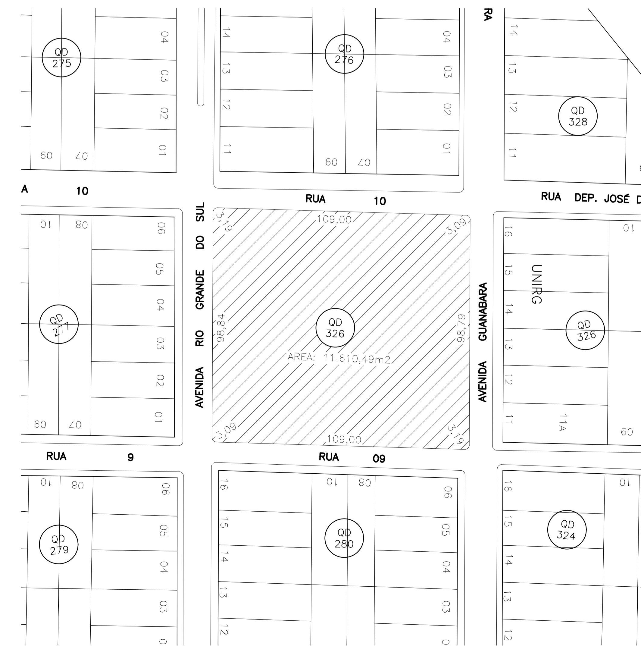
PLANTA DE SITUAÇÃO ESCALA 1 : 1000